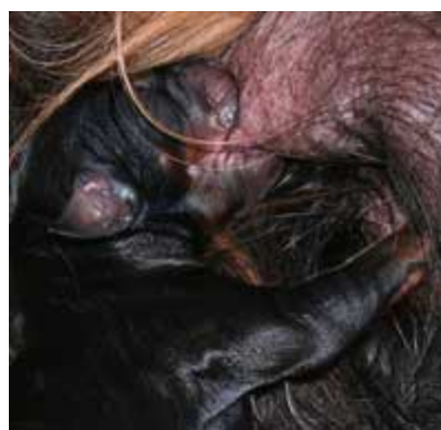
Gros petit Forrest...

J'ai regretté d'avoir infligé à ce chien un tel voyage... et je ne cesse de sourire quand je lis un mail de sa maîtresse : «He is gorgeous» «we called him Remy Fait Accompli Le Roi Des Voleurs»